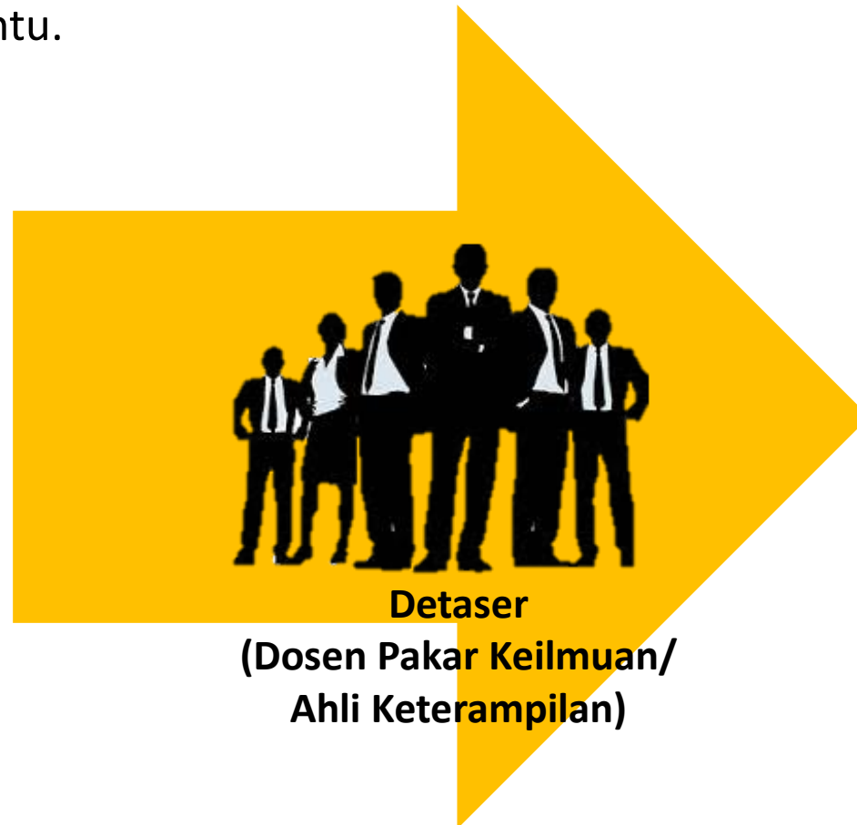
Detaser (Dosen Pakar Keilmuan/ Ahli Keterampilan)