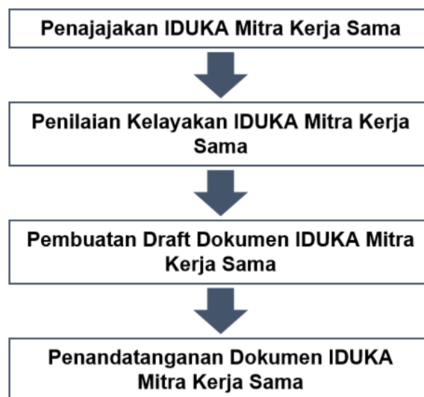
Gambar 1. Alur Kerja Sama dengan Perguruan tinggi dalam Rangka Penerapan BKP Bela Negara

Bentuk implementasi MBKM BKP Bela Negara di Untag Surabaya yang melibatkan perguruan dari luar Untag Surabaya wajib memiliki payung legalitas dalam bentuk Nota Kesepahaman/Memorandum of Understanding (MoU) dan/atau Perjanjian Kerja Sama/Memorandum of Agreement (MoA). Tahapan kerja sama dalam rangka implementasi BKP Bela Negara dijabarkan sebagai berikut: